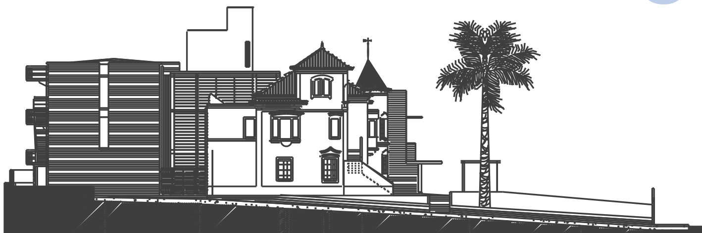
Alçados do projecto de Arquitectura fornecidos pelo Ateliê Bruno Soares Arquitectos

O recurso a tijolo à vista retoma uma indústria com passado na região, e marca a imagem do edifício, em associação com paramentos pintados a branco ou cor de tijolo.