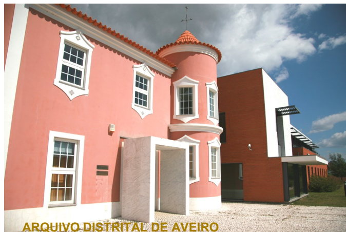
ARQUIVO DISTRITAL DE AVEIRO

No dia 22 de maio , venha conhecer o BackOffice do Arquivo Distrital de Aveiro, quem somos e o que fazemos, o funcionamento das áreas temáticas do Arquivo Distrital.